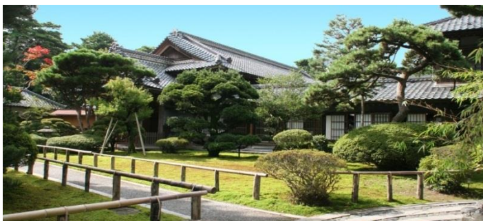
画像はイメージになります。