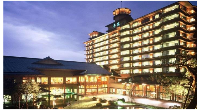
画像はイメージになります。

〒959-2395 新潟県新発田市月岡温泉134番地 TEL:0254-32-1515 FAX:0254-32-1511